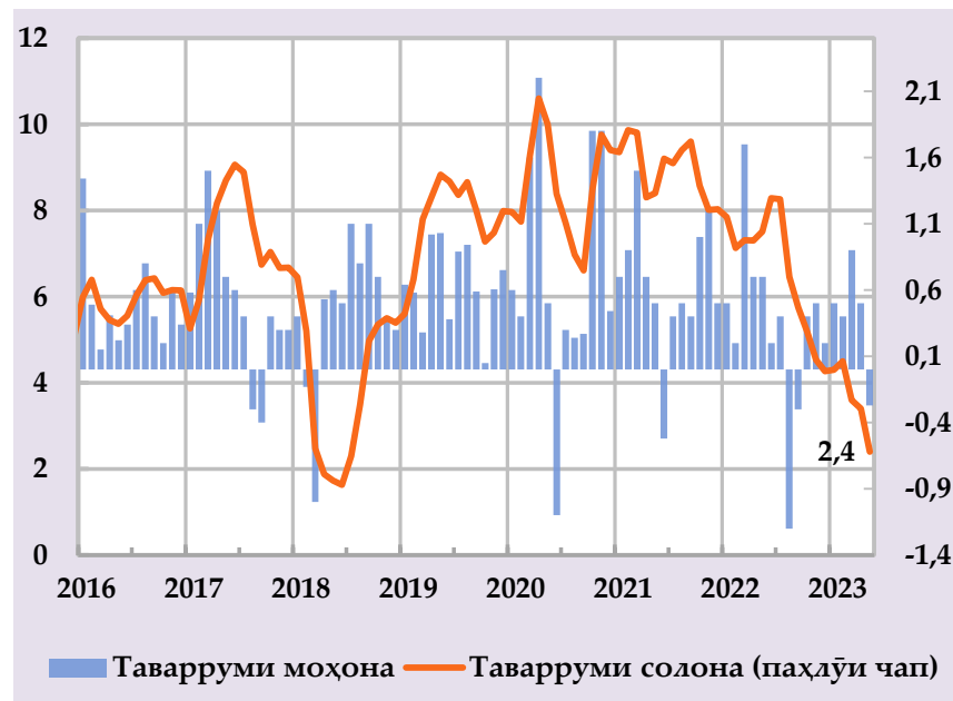
Афзоиши гурӯҳи нархҳои истеъмолӣ ва саҳми сохтории онҳо дар таварруми солона (бо фоиз) (манбаъ: Агентии омор, ҳисобҳои БМТ)