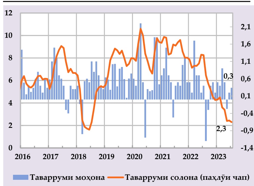
Афзоиши гурӯҳи нархҳои истеъмолӣ ва саҳми сохтори онҳо дар таварруми солона (бо фоиз) (манбаъ: Агентии омор, ҳисобҳои БМТ)