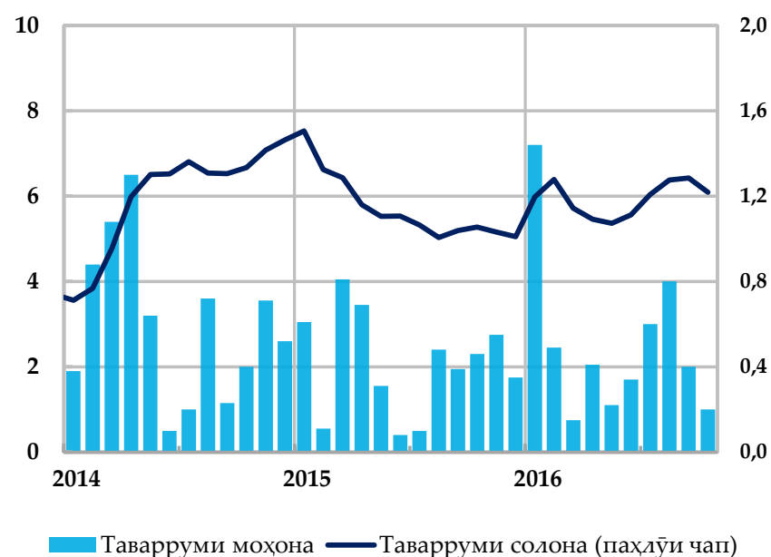
Таваррум ва таварруми асли ва саҳми сохтори он, солона бо %