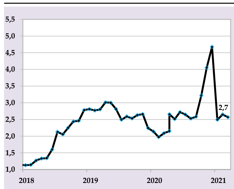
Таварруми аслии солона, бо %, (манбаъ: Агентии омор, ҳисобҳои БМТ)

Бонки миллии Тоҷикистон бо мақсади пешгирӣ ва бартараф намудани фишорҳои иловагии таваррумӣ истифодаи воситаҳои монетариро самаранок ба роҳ монда, татбиқи сиёсати мутавозуни пулию қарзиро идома хоҳад дод.