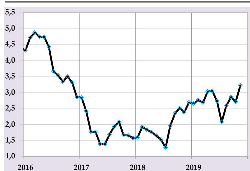
Таварруми асли, бо %, солна

Бонки миллии Тоҷикистон бо мақсади бартараф намудани фишорҳои иловагӣ ба сатҳи таваррум ва то интиҳои сол ноил гардидан ба нишондиҳандаи мақсадноки пешбинишуда татбиқи сиёсати пулию қарзии мутавозунро идома хоҳад дод.