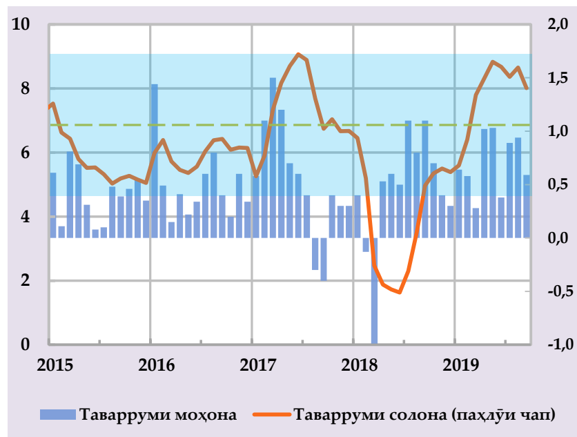
Афзоиши гурӯҳи нархҳои истеъмоли ва саҳми сохтори онҳо дар таваррум, бо % солона