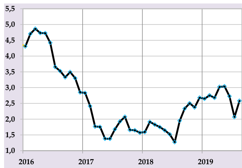
Таварруми асли, бо %, солона (манбаъ: Агентии омор, ҳисобҳои БМТ)

Бонки миллии Тоҷикистон бо мақсади бартараф намудани фишорҳои иловагӣ ба сатҳи таваррум ва то интиҳои сол ноил гардидан ба нишондиҳандаи мақсадноки пешбинишуда татбиқи сиёсати пулиро қарзии мутавозунро идома хоҳад дод.