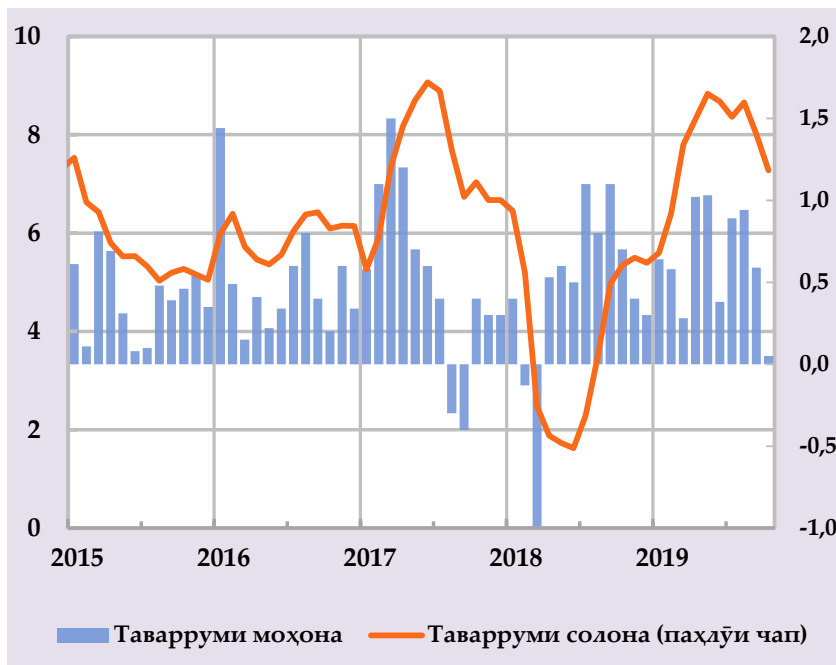
Афзоиши гурӯҳи нархҳои истеъмолӣ ва саҳми сохтори онҳо дар таваррум, бо % солона