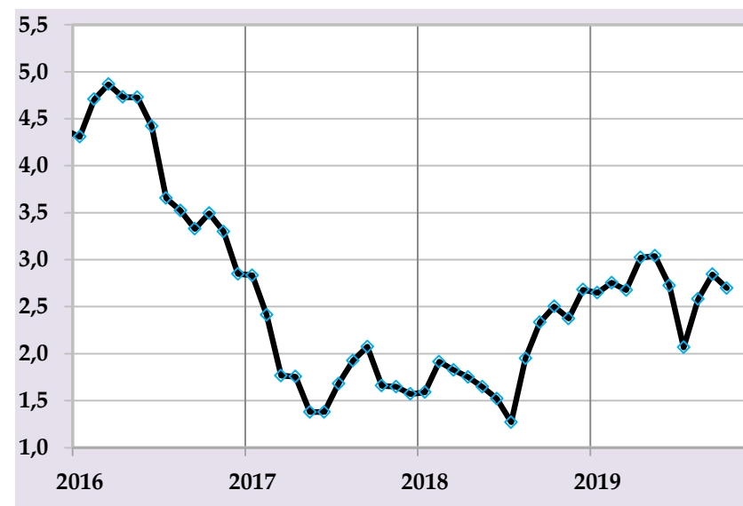
Таварруми асли, бо %, солона

Бонки миллии Тоҷикистон бо мақсади бартараф намудани фишорҳои иловагӣ ба сатҳи таваррум ва то интиҳои сол ноил гардидан ба нишондиҳандаи мақсадноки пешбинишуда татбиқи сиёсати пулию қарзии мутавозунро идома хоҳад дод.