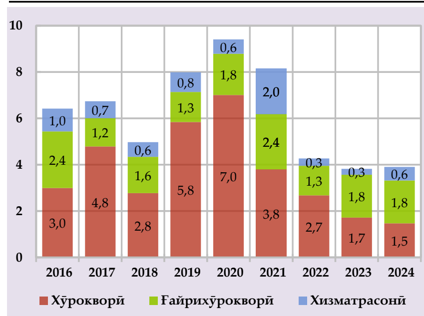
Сатҳи таваррум дар кишварҳои шарикони савдо ва минтақа (бо фоиз)