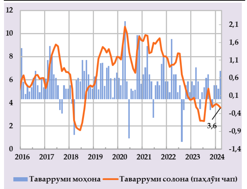
Афзоиши гурӯҳи нархҳои истеъмоли ва саҳми сохтори онҳо дар таварруми солона (бо фоиз)