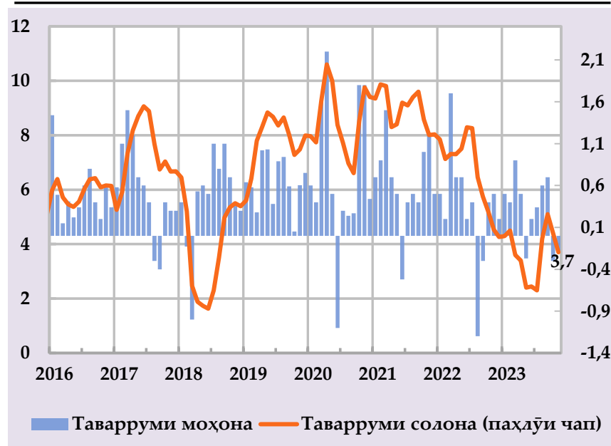
Афзоиши гурӯҳи нархҳои истеъмолӣ ва саҳми сохтории онҳо дар таварруми солона (бо фоиз) (манбаъ: Агентии омор, ҳисобҳои БМТ)